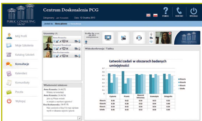
e-Platforma Centrum Doskonalenia PCG, Konsultacje